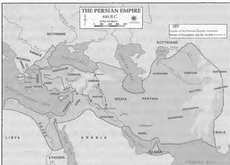
Afgʻoniston hududlari Fors imperiyasi tarkibida

Fors imperiyasi yuksalish davrida hozirgi Afgʻoniston hududlari Ahamoniylar imperiyasining bir qancha viloyatlarini oʻz ichiga olgan. Imperiyaning buyuk hukmdori Kir II mil.avv. 559–530-yillarda hukmronlik qildi va u fors imperiyasining asoschisi deb ham yuritiladi. U taxtga chiqishidan oldin Midiya sivilizatsiyasini zabt etdi, zamonaviy Iroq hududida mavjud boʻlgan ikkita davlatni oʻz saltanati tarkibiga qoʻshib oldi va mil.avv. 558-yilda fors podshohi boʻldi 3 .