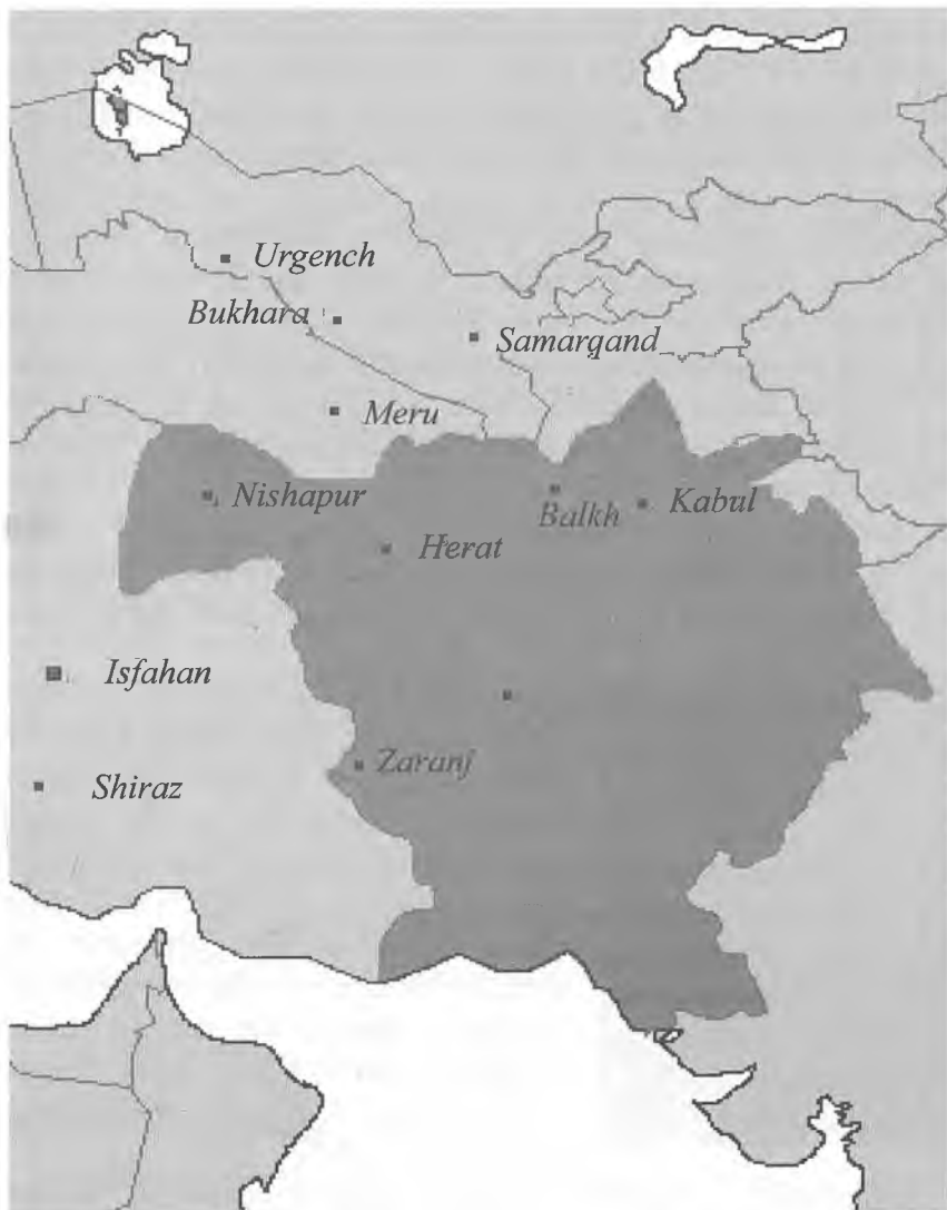
Durroniylar davlat hududi (1747–1862)

1729–1732-yillardagi harbiy harakatlari tufayli Nodirquli yetakchiligidagi qo‘shin Hirot shahrini egalladi. So‘ngra, Erondagi afg‘on qabilalari bilan bo‘lgan bir necha janglarda muvaffaqiyatga