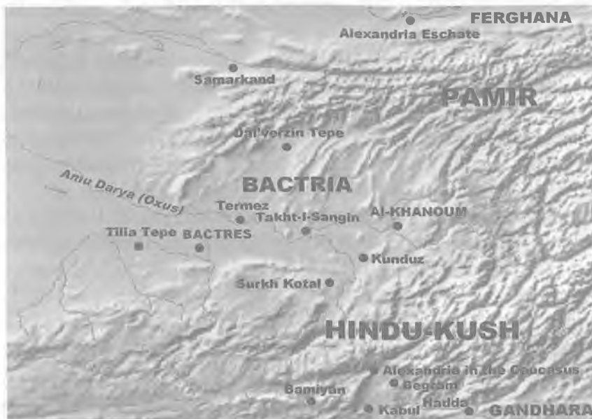
Baqtriya-yunon bosqinidan keyin

Mil.avv. 329-yilda Iskandar Amudaryoni kechib o'tdi va Bessni qo'lga olib, uni qatl ettirdi. Biroq, bu bilan Baqtriya hududida bosqinchilarga qarshi kurash to'xtab qolmadi. Amudaryoning o'ng sohilida va So'g'diyona (hozirgi O'zbekiston) hududida Iskandarga qarshi Spitamen boshchiligida keng ko'lamlı xalq qo'zg'oloni boshlandi. Iskandar ushbu qo'zg'olonni bostirish uchun uch yil vaqtini sarfladi. Shunda ham Spitamenni qo'lga ololmadi. Qo'zg'olonchilar bosqinchilarga qarshi pistirmalar qo'yish va yirik janglarga kirmaslik taktikasini qo'llab qaqshatqich zarba berdilar.