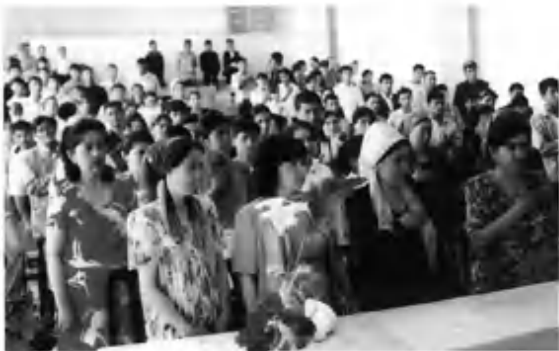
Шоир ёди юрагимизда. Марҳамат туманидаги Агросаноат коллежида хотира талбири.