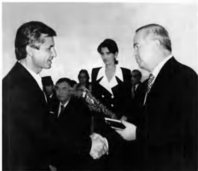
Ўзбекистон Президенти Ислам Каримов Муҳаммад Юсуфга “Халқ шоири” унвонини топширмақда. 1998 йил.

Сен шохлари осмонларга Мегиб турган тинорим. Ота десан. Ўзим деб. Бош эгиб турган тинорим. Қўнмигдаш ифтихорим. Қўнмигдаш тўнорим. Ўзинг менинг қўнмардан Ўқинсан, Ватаним!