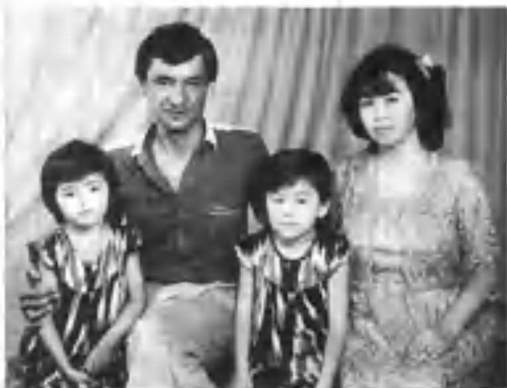
«Жужуқларим менинг камолим».