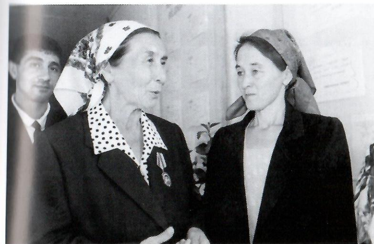
Ўзбекистон Қаҳрамони Анора Маҳмудова (чапда)