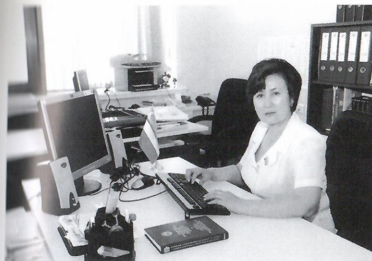
Ўзбекистон Республикаси Олий Мажлиси депутаты Ойша Охунова