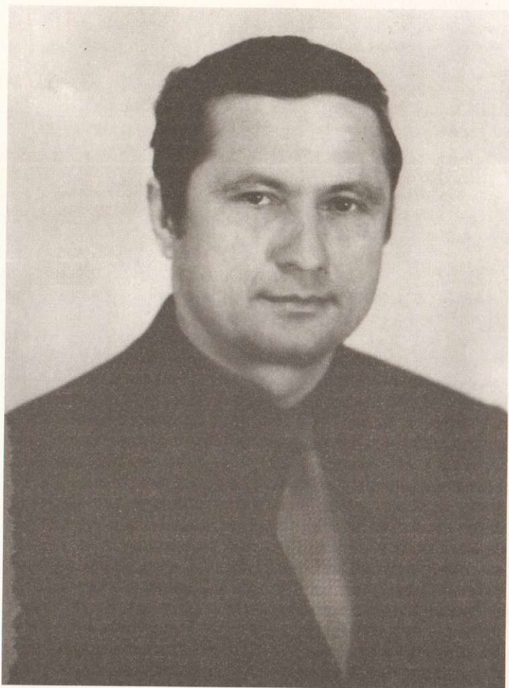
SHARD - MASHNET - MATIAA ALTRAPARK KOMPAKCHEN BOB TAKHINKIN TOURBET - 219