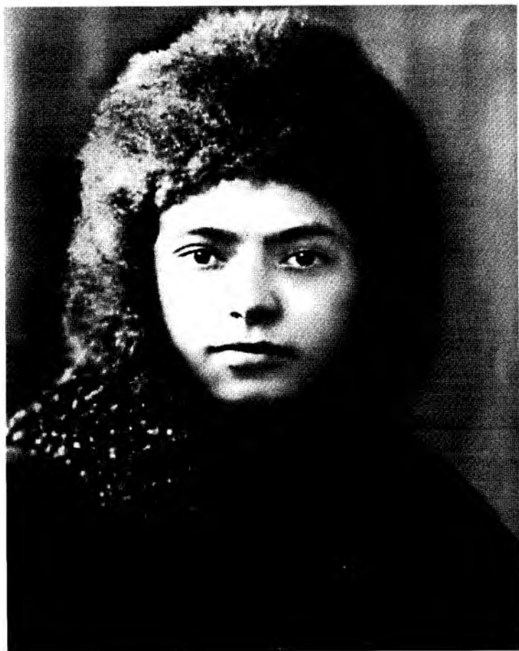
Ойбек. Ленинград, 1929 йил