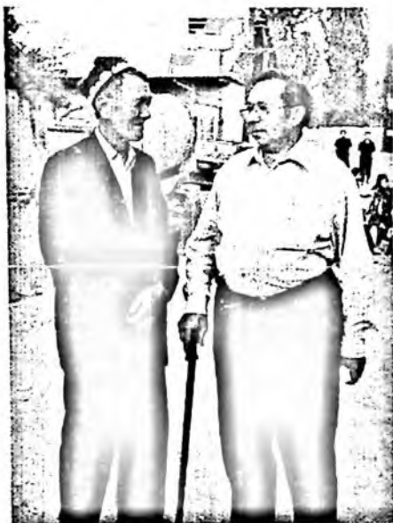
Ўзбекистон халқ ёзувчиси Тохир Малик билан