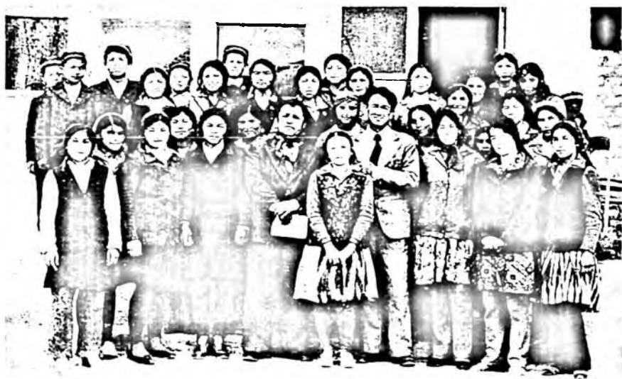
Чортоқ туманидаги 25-ўрта мактаб ўқувчилари шоир Темур Убайдулла ва Оташ Холмирзаевлар билан