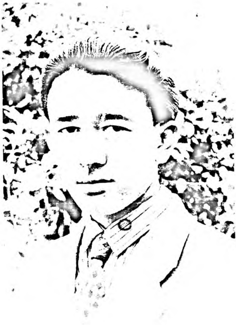
Шоир ва ёзувчи Оташ Холмирзаев