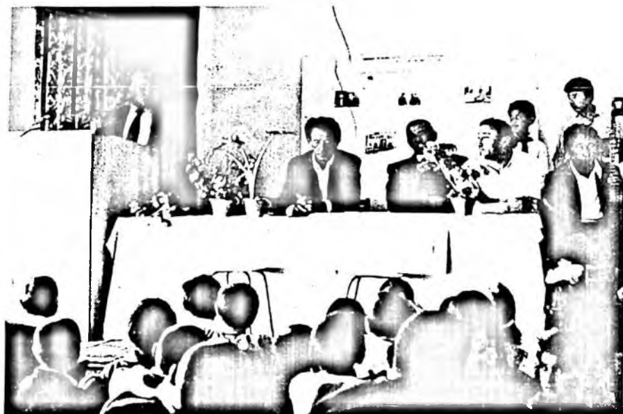
Шоир 115-мактаб-интернатда ўтказилган ижодий кечада