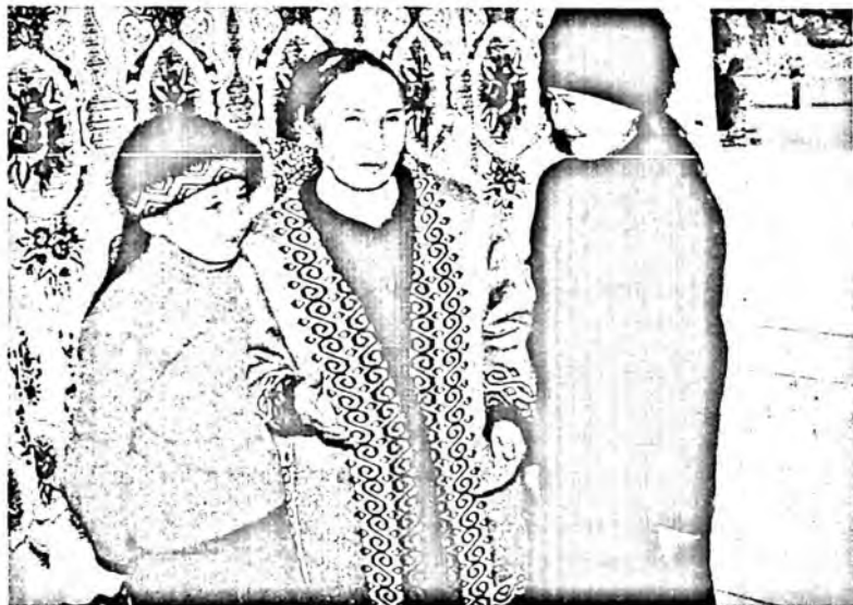
Оилам ва набираларим