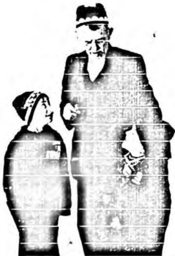
Набираларим Азизбек ва Мираббослар билан