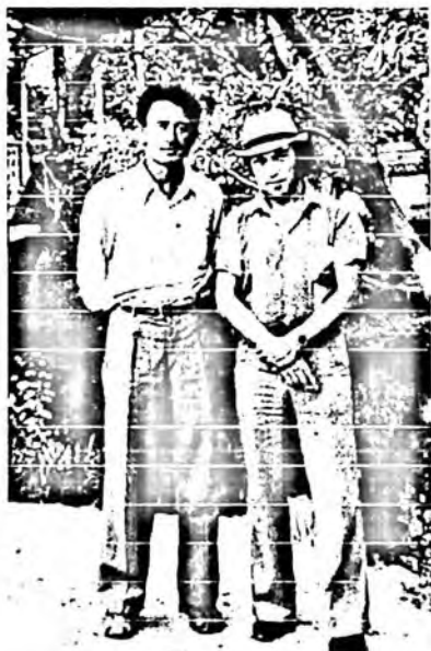
Ўзбекистон халқ ёзувчиси Шукур Холмирзаев билан