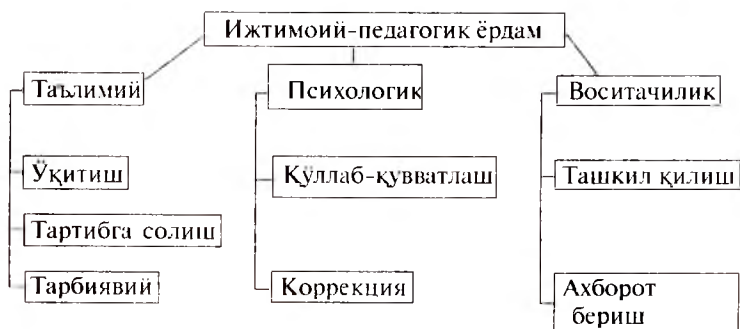
2-расм. Ижтимоий-педагогик ёрдам тизими

Ижтимоий педагогнинг оиладаги асосий фаолиятини ижтимоий педагогик ёрдам ташкил қилиб, бу ёрдам таълимий, психологик ва воситачилик кўринишларида намоён бўлади.