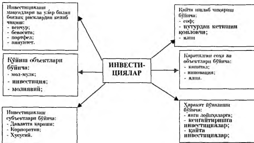
1-чизма. Инвестицияларнинг классификацияси

Хар бир муайян ҳолатда капиталнинг ҳозирги қийматини жиддий йўқотиш рискинни пасайтиришга инвестицияларнинг мақсадлари, яъни уларнинг хавфсизлиги, даромадлиги, капиталлашуви ва ликвидлигини таъминлаш орқали эришилади.