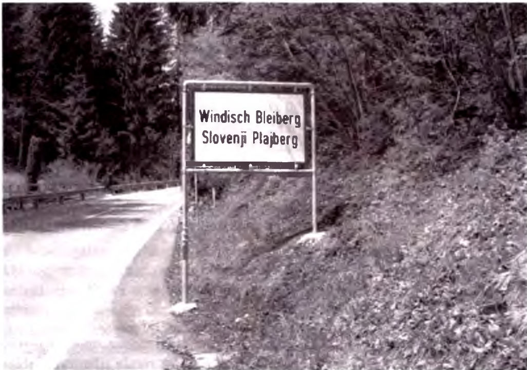
Kertnendagi joy nomlari yozilgan ikki tilli ko'rsatgichga barham berildi.

o'ziga xosliklarini saqlab qolishga va'da berildi. Shunga qaramasdan, tez orada slovenzabon xalq guruhiga nisbatan kuchli assimilyatsiya bosimi o'tkazildi. Sloven tili va yozuvi kamsitildi, ikki tilli maktablarda nemis millatiga mansub o'qituvchilar dars berishni boshladi.