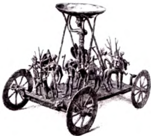
Shtrettveg qatl mashinasi.

Ostarrichi nomi qayd etilgan tarixiy manba.