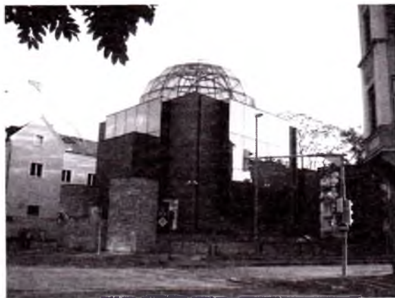
Gratsdagi yangi sinagog.

Tarixiy manbalarga asoslanadigan bo'lsak, X asr boshlarida Venada yahudiylar umr kechirgan. Vahshiyona tazyiqlar va doimiy bosim natijasida ular soni XIX asrgacha chegaralangan bo'lgan. XX asrga o'tish davriga kelib Venajuda boy, yahudiylarga xos hayot kechirgan, shahar sionizm markaziga aylantirilib, Vena yahudiylari madaniyat va ilm sohasining barcha jabhalarida diqqatga sazovor darajada faollik ko'rsatdi. 1938-yilda Venada 180 000 yahudiy yashardi, ularning ko'pchiligi ommaviy qirg'inni boshdan kechirmagan.