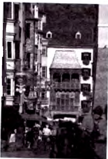
Innsbruk, oltin tom.

Tirolidagi 350 000 ga yaqin mehmonxona o'rinlari (2011/2012), nemislar bilan bir qatorda, niderlandiyalik, shvetsariyalik va avstriyalik mehmonlar to-