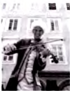
Motsart tug'ilgan uy.

to'lib ketadi. Motsartning ona shahri bo'lgani uchun ham dunyoning musiqa markazi hisoblanadi. 1920-yildan beri nishonlanadigan Zalsburg festivali dunyoning to'rt tarafidan qiziquvchilarni o'ziga chorlaydi. Minnatdorchilik sifatida shaharda Motsart nomli konservatoriya barpo etilgan va u yagona oliygoh sanaladi.