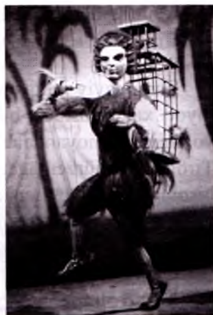
Motsart. «Sehrli nay».

Avstriyaning musiqiy vatani an'anasini davom ettirayotgan musiqachilar ham soliq to'laydi. Ular, dirijor va qo'shiqchilar gonorarlarining yuqoriligiga qaramasdan, an'analarning davom etishiga imkon yaratmoqda. Bu ishni ular faxr tuyg'usi bilan amalga oshiradi.