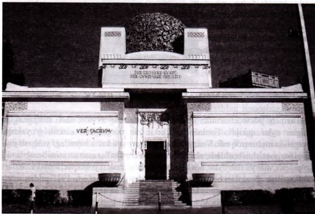
Vena Nashmarktdagi Setsession binosi.

Bu oqim namoyandalari dekoratsiyalarni yaxshi ko'rgan va uylarni tillarang naqsh va marmar koshinlar bilan bezatgan. Venadagi Otto Vagner tomonidan pochta jamg'arma binosining mayda kesilgan g'ishtlardan qurilgan fasadi sodda va tejamkor, biroq o'ziga xos ahamiyat kasb etadi. Venadagi Karlsplatzda joylashgan shahar temir yo'l bekati va