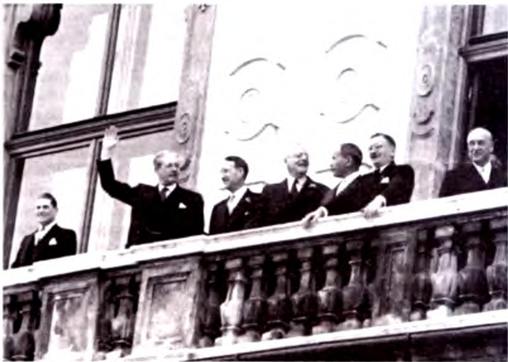
Butun Avstriya aholisi davlat bitimidan shod boʻldi.

Karl Renner (1870–1950) boshchiligidagi vaqtinchalik hukumat Avstriya Respublikasining qayta tuzilganligini eʼlon qildi. Bu holat koalitsiya aʼzolari tomonidan tan olinib, butun Avstriya boʻylab kuchga kirdi. Koalitsiya aʼzolari mamlakatni 4 qismga boʻldi, ammo davlatning yaxlitligi saqlab qolindi. Koʻpgina qiyinchiliklarga qaramasdan, urush xarobalari nisbatan tez muddatda qayta tiklandi. «Iqtisodiy moʻjiza» Avstriyaga ham yetib kelishi lozim edi. Umuman olganda, Birinchi Respublika davridagi xatolardan odamlar koʻp narsani oʻrgangan edi. Ikkita katta siyosiy partiya birlashib, yagona koalitsiyaga aylandi va 1966-yilga qadar qatʼiy va samarali hamkorlikda faoliyat yuritdi.