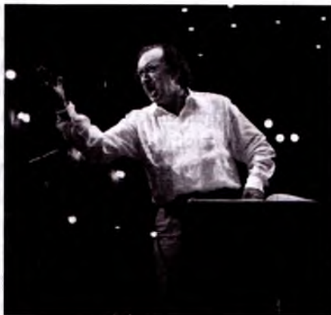
Harnonkourt hozirgi kunning mashhur dirijorlari sirasiga kiradi.

Dunyoga dong'i ketgan dirijorlar ham avstriyalikdir. Gratslik Karl Bo'm (1894–1981) va zalsburglik Herbert fon Karayan (1908–1989) ham eng mashhurlardan bo'lgan. Ular plastinkalarining millionlab nusxalari bor.