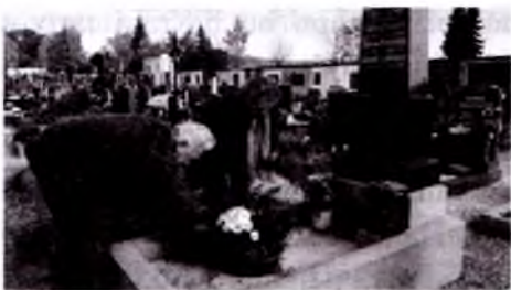
Odamlar o'z yaqinlarining qabrlarini tartibga keltiradi.

oilalar uylariga uning kelishini istamaydi. Ko'plab shaharlarda, ayniqsa, Tirol, Kernten, Zalsburg va Shtayermarkda sun'iy yasalgan Krampus maskalari taqiladigan Krampus yurishlari bo'lib turadi.