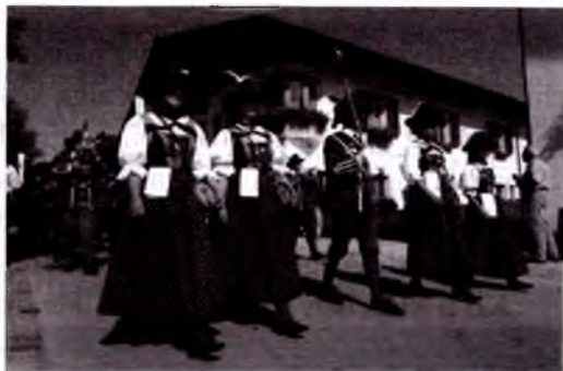
Avstriyada 2000 ga yaqin puflab chalinadigan musiqa asboblari orkestri mavjud.

Avstriya qishloq aholisi musiqiy layoqatidan xabar beruvchi xalq musiqasi mamlakatda katta ahamiyatga ega. Turli hududlarda yuzaga kelgan ashula va raqslar hozirgacha saqlanib qolgan. Kerntern hududi xor jamoalari ashulalari mamlakat tashqarisida ham yaxshi tanilgan. Avstriya musiqiy madaniyatida puflab chalinadigan musiqa asboblarning o'ziga xosligi. Hozirgi kunda 2000 dan ortiq musiqiy kapellalar va 80 000 ortiq musiqachilar mavjud. Ko'p sonli konsertlar va musiqa festivallari Avstriya madaniy hayotining tarkibiy qismi hisoblanadi.