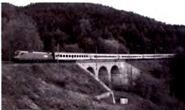
Semmering, Quyi Avstriya.

Bir necha asr mobay- zida Vena o'lkani- ng bosh- qaruv markazi bo'lgan va 1920-yilda Quyi Avstriya turkibidan ajratib olingan. Shunga qaramasdan, Vena Quyi Avstriya uchun poytaxt vazifasini keyinchalik ham o'tagan. Ammo bu holga 1986-yilda chek qo'yildi. Ovozga qo'yish va uzoq muzokaralardan so'ng (say-