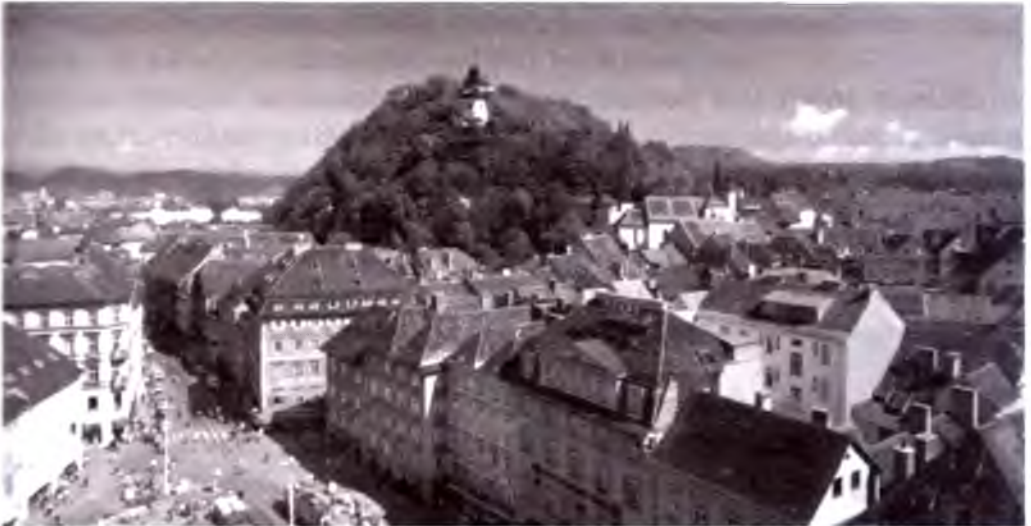
Grats, Shlossberg va bosh maydon.

Shtayermark maydoni bo'yicha Avstriya Respublikasida ikkinchi o'rinda turuvchi federal o'lkadir. Aholi statistikasi bo'yicha esa Vena, Quyi va Yuqori Avstriyadan so'ng to'rtinchi o'rinda turadi.