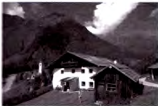
St.Zigismunddagi qishloq uyi.

tabiatga eng ko'p ziyon yetkazuvchi omil yillar davomida qatnayotgan transport vositalari oqibatida yuzaga keladigan qor ko'chishidir. Tirol Shimoliy va Janubiy Yevropa sanoat va dam olish mamlakatlari o'rtasidagi asosiy tranzit o'lkadir. Ayniqsa, yozda federal o'lkaning tranzitligi katta qatnov muammolarini keltirib chiqaradi. Avtomobillar qatnovini temiryo'l qatnovi bilan almashtirish haqidagi g'oya ba'zilar tomonidan qo'llab-quvvatlansa ham, tez orada amalga oshirib bo'lmaydigan vazifa hisoblanadi.