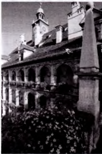
Gratsdagiy hokimiyat binosi.

Uyg‘onish davri Avstriyada bir asr ham davom etmagan noan’anaviy uslub hisoblanadi. Avstriyada hozir ham reformatsiyalar, ya’ni to‘ntarishlar, o‘zgarishlar natijasi bo‘lgan uyg‘onish davri san’ati mavjuddir.