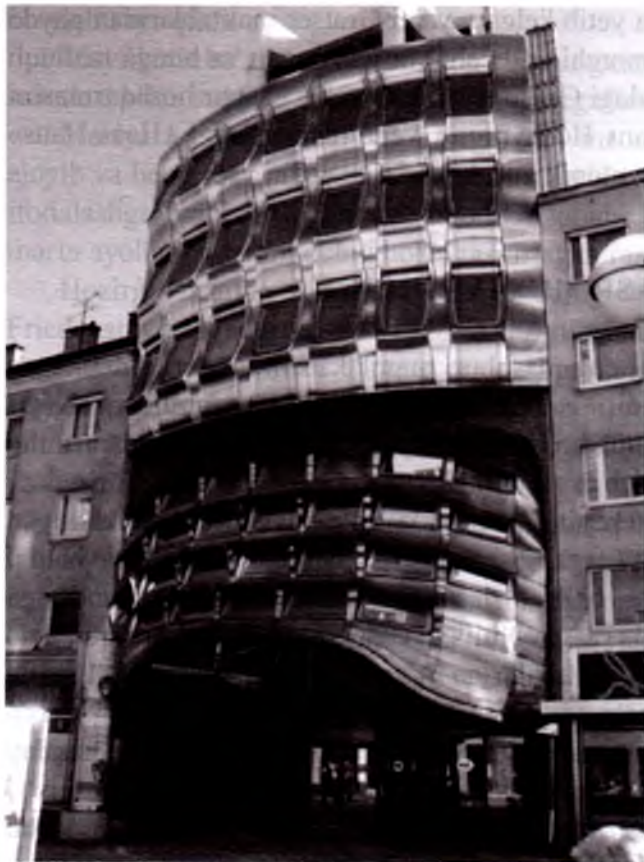
Vena Favoriten ko'chasidagi jamg'arma g'aznasi.

lifiga aylandi. Klemens Holsmayster Avstriyaning cherkov qurilishiga oid arxitektura ishlari bilan dunyoga mashhur bo'ldi. Holzmeister qolganlarga nisbatan Zalsburgda ikki festival uchun maydonchalar qurdi. Rolan Rayenerning Venada qurdirgan binosi Avstriya, Yevropa me'morchiligida muhim ishlardan hisoblandi.