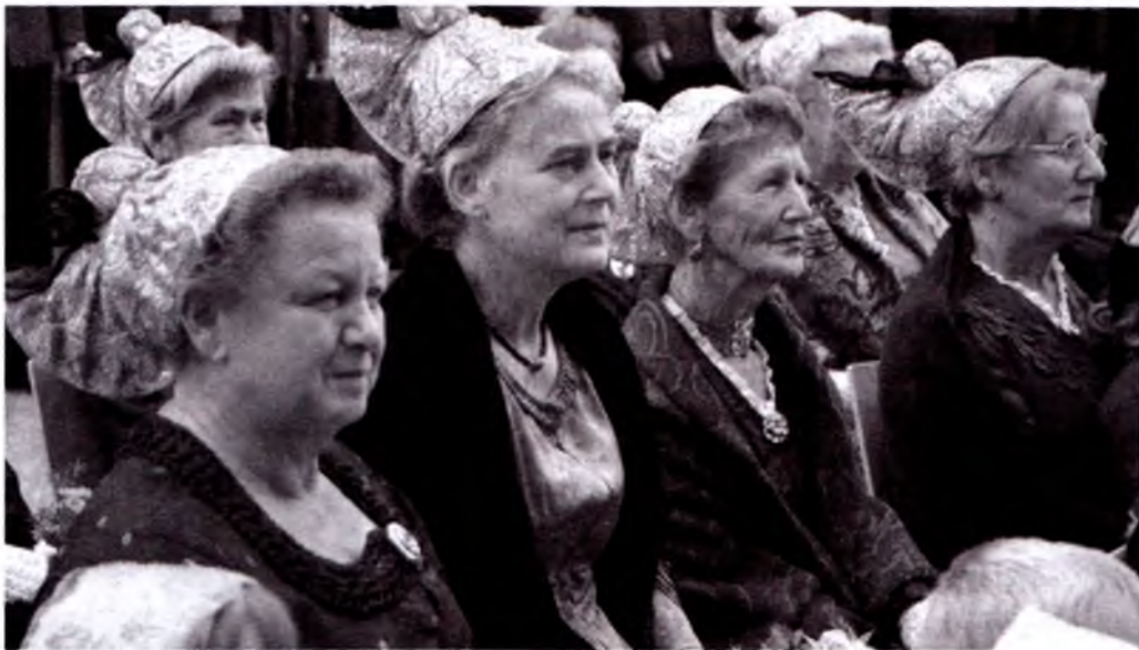
Tillarang ro'mollar bayramlarda o'raladi.

Shaharning kazo-kazolari (siyosat, iqtisod va san'at sohalarining taniqli namoyandalari) uchun ham fasching (karnaval)dagi oxirgi payshanbada bo'ladigan Opera bali yilning eng shov-shuvli voqealaridan biridir. Vena davlat opera teatri minglab gullar bilan bezatilib, ulkan raqs zali tusini oladi. Bu balning har yilgi ochilish marosimi an'anaga aylanib qolgan. Ushbu tadbir «Staatsball» («Davlat bali») deb ham ataladi. Federal prezident tashrif buyurishi bilanoq federal madhiya yangraydi, 144 nafar debyutant juftlik esa Polonez (raqs turi) ga raqs tushadi. Undan keyin opera va balet chiqishlari boshlanadi, ba'zi solistlar o'zlarining eng yaxshi ariyalarini ijro etadi, so'ngra besh minglar atrofidagi kecha mehmonlari ham raqs tushishi mumkin. Ayni damda Venadagi mashhur Opera bali dunyoning o'zga davlatlarida o'z taqlidchilariga ega bo'lib, hatto, bu jarayonga qarshi bo'lib turadigan namoyishlar ham an'anaga aylanib qoldi. Fashingning yakunlovchi qismi sevimli baliqli taom bo'lmish «Heringsschmaus» (selyodkali taom) iste'mol qilinadigan «Aschermittwoch» (kulchorshanba)dir. Qadimgi odatlarga ko'ra, (pasxa ro'za oyi)da tanovul qilinadigan baliqli taom bilan bugungi «Heringsschmaus» ning o'xshash jihatlari ko'p emas, chunki avvalgi oddiy yegulikdan eng sara, laziz taom vujudga kelgan.