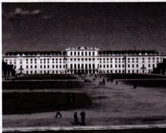
Venadagi Sho'nbrunn qasri.

XVII asrga kelib Avstriya katta hokimiyatga ega bo'ldi. Turklar g'olib chiqdi va imperator mamlakat poytaxtini Yevropaning eng chiroyli shahriga aylantirishga qaror qildi. Uning Shonbrunn'dagi qasri raqobatdoshi Fransiya qirolinikiga qaraganda chiroyli va hashamatli bo'lishi kerak edi. Zodagonlar unga hashamatli saroy qurishni maslahat berdi. Katoliklar cherkovi oxirida uning protestantlar ustidan g'alabasini shu davrdagi me'morchilik inshootlari