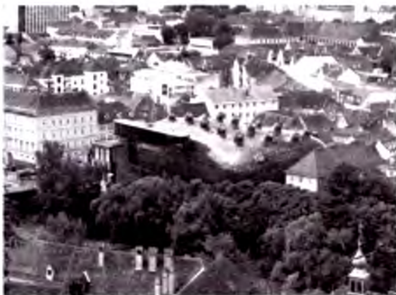
Gratsdagi san'at uyi.

qarab farqlanadi. O'lkaning eng quyi qismi dengiz sathidan 209 m balandlikda joylashgan Janubiy Vaynland bo'lib, u yerda yoqimli quyoshli iqlim hukmronlik qiladi. U yer Avstriyaning eng go'zal tog' manzaralarini o'zida mujassam etgan. Daxshteyn tog' tizmasining Yuqori Alp mintaqasigacha mashinada bir necha soatlik yo'l. 2 995 m balandlik bilan Daxshtayn bu federal o'lkaning eng yuqori nuqtasi hisoblanadi.