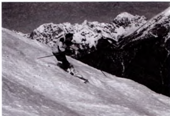
Tirol da chang'i uchish.

Sayohat avstriyaliklarning katta qismi uchun haligacha sohilda yotish, cho'milish va bekorchilik qilishdan boshqa narsani anglatmaydi. Ayniqsa, bu bolalarga tegishli. Imkoni boricha, ko'proq narsalarning guvohi bo'lish va yangi tanishlar orttirish sayyohlarning uchdan bir qismini tashkil etuvchi 19 yoshgacha bo'lganlar uchun ahamiyatlidir. Yoshlarning nazarida esa Avstriya – sovuq, qimmat, ustiga ustak zerikarli va eskirgan makon.