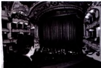
Gratsdagi opera teatri-ning ichki ko'rinishi.

Avstriya shahar operasi va qirollik teatri-dangina iborat emas. Hajviy opera va operettalar namoyishiga ixtisoslashtirilgan opera va zamonaviy spektakllar qo'yiladigan akademik teatr ham bor.