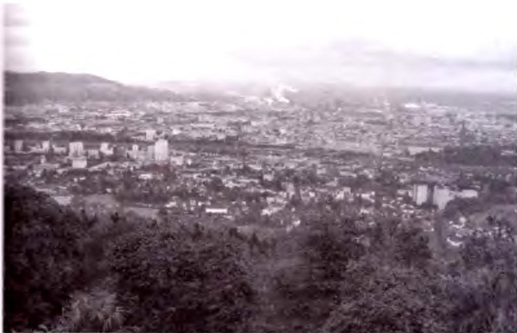
Po'stlingberg tomondan Linsning ko'rinishi.

dagi aholi sonining kamayishi bilan parallel tarzda sodir bo'lyapti. Ayniqsa, ikkinchi jahon urushi mobaynida va 1945-yildan so'ng sanoat to'xtab qoldi. Sanoatlashuv esa Linsni Avstriyaning aholi zich joylashgan ikkinchi o'rindagi hududiga aylantirdi. Iqtisodda bo'y ko'rsatgan sohalar esa temir va cho'yan, kimyo sanoati hamda mashinasozlik (BMW) bo'ldi. Hamma korxonalar nemis mashina sanoatiga vositachi sifatida mas'uldir. Lins Yevropadagi eng ozoda sanoat shahri hisoblanadi. Yuqori Avstriya 2013-yilda davlatda eng kam ish o'rni tashkil etgan.