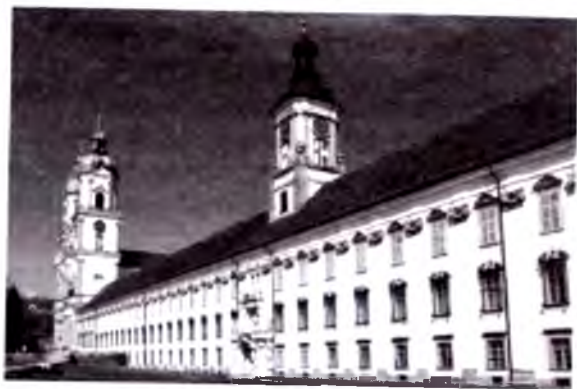
St. Florian cherkovi.

Shimolda joylashgan Myul kvartali linsliklarning eng xush ko'radigan dam olish maskani sanaladi. Janubda Zalskammerning sanoqsiz romantik ko'llari, g'arbda esa qayta ta'mirlangan ko'rkam Braunau va Sherding kabi shaharlarni uchratish mumkin. Barokko davridan buyon saqlanib kelayotgan monastirlar kishilar tomonidan juda qadrlanadi.