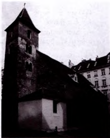
Venadagi St.Rupreht cherkovi.

«Romantik» ifodasi Rim san'ati uslubidagi elementlarda (arkalarda, bino ustunlarida) paydo bo'la boshlagan. Avstriyada romantik san'at uslublari babenberglar sulolasi davrida eng gullagan davrni boshdan kechirdi. Shu davrdagi cherkov va boshqa binolar bugungacha saqlanib qolgan. Qadimiy xristian Bazilika davridan rivojlangan romantik uslubdagi cherkovlarning ko'pchiligi uch xonali bo'lgan. Tomlari oldin tekis va taxminan 1100-yildan boshlab ko'prik shaklida bo'lgan. Mamlakat sharqida dafn marosimini o'tash vazifasini bajaruvchi cherkovlar joylashgan bo'lib, g'arb ustunlarida ko'pi bilan ikkitadan, biri katta minora, oddiy, past shiftli bo'lgan. Cherkov devorlarining ichi g'ovak,