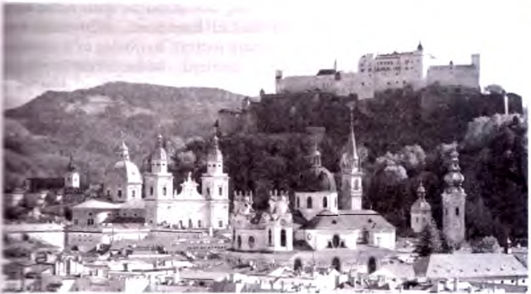
Zalsburgning umumiy ko'rinishi.

bo'lib, asrlar mobaynida tuz federal o'lka hududi aholisining obod va farovon yashashini ta'minlab kelgan. Zalsburgning 80% qismi tog'li hudud bo'lib, shimoli-sharqda Zalskammergut ko'lga boy joydir.