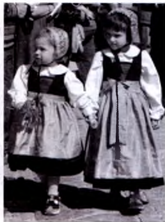
Bayramda barcha ishtirok etadi.

Yanvarda butun Avstriyada «Fasching» (G'arbiy hududlarida «Fastnacht» ham deyiladi) nishonlanadi. Ayni paytda maxsus pechenyalar tayyorlanadi, bayram qatnashchilari, bayram shahzodalari va malikalari shahar bo'ylab aylanib chiqadi. «Fillax fasching»i Reyn karnavalining eng ko'ngilochar shousi sifatida televizordan uzatiladigan sevimli dasturdir. Hammadan ham ko'ra «Fashing» ballar va raqs kechalari uchun qulay paytdir. Bir qancha uyushma va tashkilotlar (masalan, shifokorlar, huquqshunoslar, mo'ri tozalovchilar, qandolatchilar va qassoblar) ning ishchi guruhlari, ko'pincha, mashhur siyosatchilar qadrli mehmon sifatida taklif etiladigan ballarni uyushtiradi. Gimnaziya dagilar o'zlarining bitiruv oqshomlariga, istaganlari esa «Gschnasfest» yoki niqoblar bayramiga boradi.