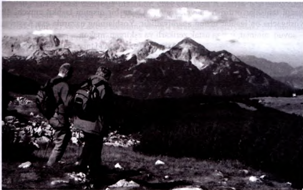
Sayohatga chiqish – avstriyaliklarning sevimli mashg'uloti.

ta'kidlashicha, tozalik va xavfsizlik, shu bilan bir qatorda, turli-tuman go'zal sayrgohlar, beg'ubor tabiat, mehmonnavozlik va boy madaniy meros kishilarni o'ziga rom etadi. Yana bir afzal tomoni shundaki, deyarli barcha oromgohlarga oson va tez borsa bo'ladi. Bu sohada Kernten (Avstriyadagi tarixiy viloyat) birinchi o'rinda turadi, keyingi pog'onalarni esa Shtayermark, Zalsburg va Tirol band etgan.