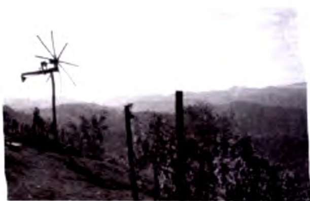
Janubiy Shtayer uzumzorlari.

Grats 400 000 nafar aholisi bilan Shtayermarkning iqtisodiy markazi sanaladi. Grats nafaqat Shtayermarkning poytaxti, balki, o'z navbatida, universitet, teatr, ko'rgazma, boringki, madaniyat markazi ham hisoblanadi. 2003-yilda unga Avstriyadagi birinchi «Yevropa madaniyati poytaxti» maqomi berildi. O'rta asrlarning so'ngida bu yerda