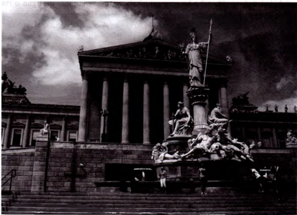
Venadagi parlament binosi.

Qirol Frans Yozef 1857-yilda Vena shahri ichkarisini qayta tuzish va qo'shilgan joylarni qayta qurish uchun farmon beradi hamda Ring ko'chasi ( Ringstraße ) paydo bo'ladi. Ushbu yangi ko'cha bo'ylab ochiq imoratlar va saroylar, xiyobonlar va haykallar qad rostlaydi. Me'morlar bunda oldingi