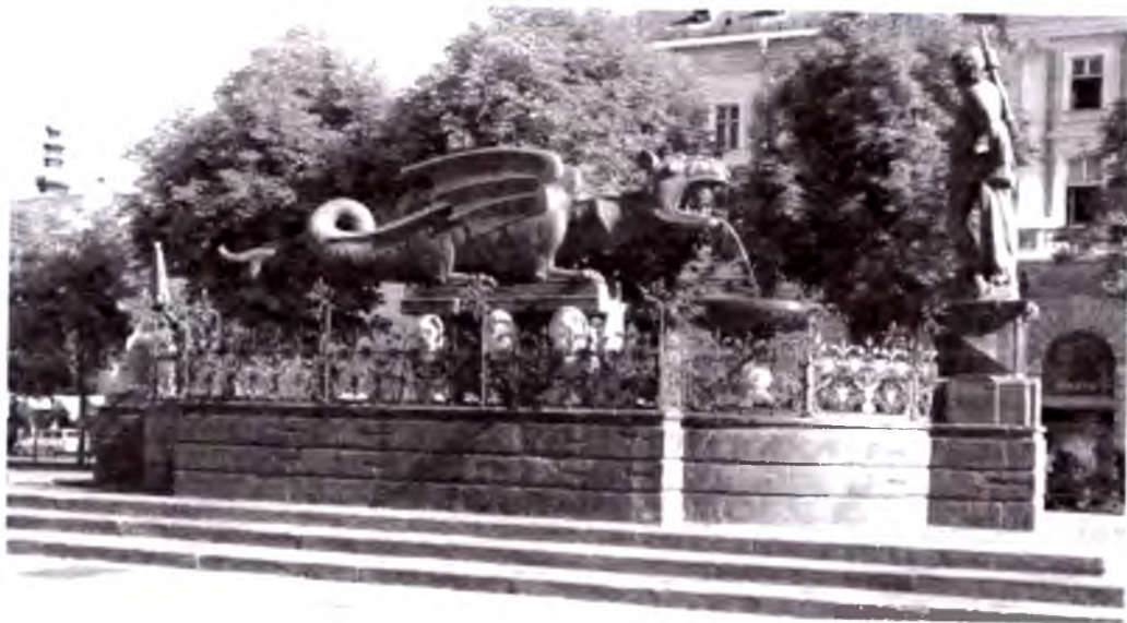
Ajdarho Klagenfurt ramzidir.

Kernten Avstriyaning federal o'lkalari orasida beshinchi o'rinda turadi, biroq Avstriyaning atigi yetti foiz aholisi bu yerda istiqomat qiladi. Alp tog'ining janubiy qismini to'liq egallagan yagona federal o'lka Kerntendir. Bu yerdagi ko'llarning suvi toza va ozoda bo'lib, deyarli barchasida ichimlik suvi sifatлари