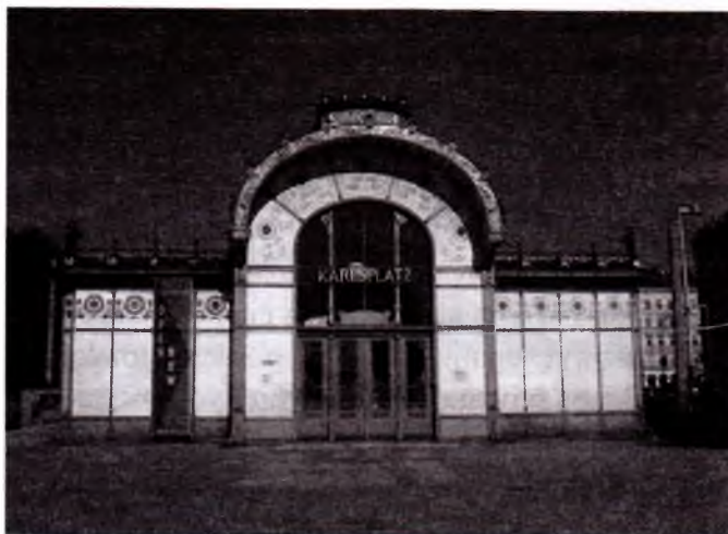
Otto Vagner shahar temiryo'li.

Bu oqim namoyandalari dekoratsiyalarni yaxshi ko'rgan va uylarni tillarang naqsh va marmar koshinlar bilan bezatgan. Venadagi Otto Vagner tomonidan pochta jamg'arma binosining mayda kesilgan g'ishtlardan qurilgan fasadi sodda va tejamkor, biroq o'ziga xos ahamiyat kasb etadi. Venadagi Karlsplatzda joylashgan shahar temir yo'l bekati va