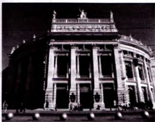
Vena Burg teatri.

Bundan tashqari, Vena shahrida xususiy teatrlar mavjud bo'lib, eng qadimiy va nufuzlisi «Yozef ko'chasidagi teatr» deb ataladi. Kichik teatrlar ichida Vena improvizatsiya teatri Yevropada yagonadir. Teatr hayoti faqat Vena bilan cheklanmaydi. Hududiy teatrlar sahnalarida operadan boshlab myuziklgacha, klassikadan tortib zamonaviy asarlargacha namoyish etiladi. Venadagi katta teatrlarga qaraganda sarmoyasi kamligi bilan ajralib turadi. Grau shahridagi