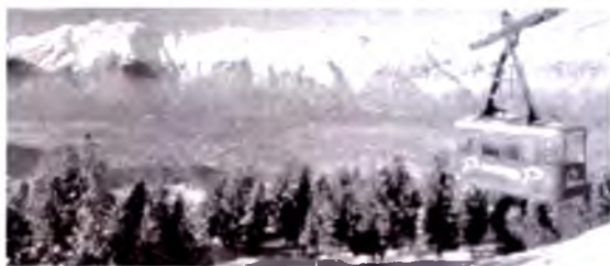
Pacherkofel, Innsbrukning janubi-sharqiy tomondan ko'rinishi.

Sayyohlar oqimi o'zi bilan birga ko'plab ekologik muammolarni olib kelyapti. Chang'i va osma tog' yo'llari qurish evaziga butun boshli o'rmonlar yo'q qilinmoqda. Oqibatda vodiylar qorbo'ronlar va seldan katta jabr ko'ryapti. Tirolidagi insonlar va