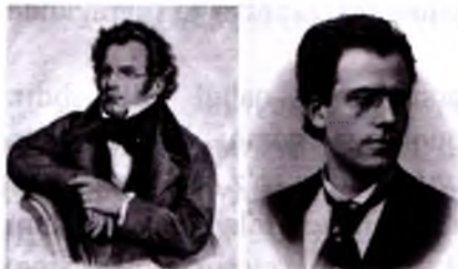
Frans Shubert. Gustav Maler.

Avstriya butun dunyoda musiqa mam-lakati hisoblanadi. Bu yerda Haydn, Mot-sart va Betxovenlar yashab ijod etgan, shu-ningdek, zamondosh bastakorlar Gustav Mahler, Arnold Sho'nberg va Alban Berglar ham. 1-yanvarda Vena filarmoniyasi o'zining yangi yil konsertini berganida butun Yev-ropada millionlab odamlar uni ko'radi, hatto, dengizorti mamlakatlari fuqarolari ham.