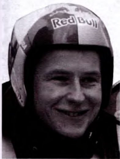
Andi Goldberger – Avstriyaning mashhur chang'i uchuvchisi.

Velosipedda uchish, suzish, yugurish, yov sayohatga chiqish va albatta chang'ida uchish ko'pgina avstriyaliklarning sevimli sport turlaridir. Bir necha yillar ilgari bir qator qiziqarli sport turlari, ayniqsa, yozda rolikda uchish va qishki snoubord avj olgan edi. Ayniqsa, yoshlar uchun orzu qilingan sport turlariga parashyutdan sakrash va varrak uchirish kiradi. Syorfing va yelkanli qayiqda suzish ham ushbu ro'yxatdan joy olgan.