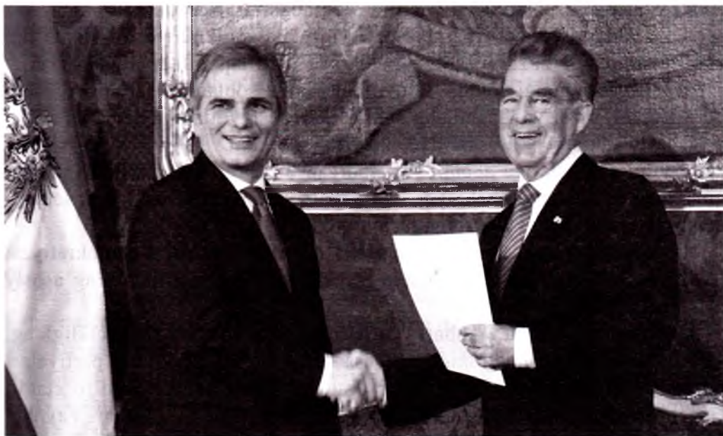
Federal kansler Verner Faymann (chapda) va Federal prezident Hayns Fisher (o'ngda).

Avstriyada YI ga nisbatan shubha-yu gumonlar oshib borayotgan bir paytda YI ning siyosatdonlari Avstriya hukumatidagi ishlar va Avstriya Ozodlik partiyasi (AOP)dagi siyosiy muhit qanday ekanligi haqida bayonnoma tayyorlash asnosidagi «3 tamoyil» nomli chora izlayotgandi. Bu bayonnoma hukumatga ijobiy ta'sir etib, hattoki, AOP (FPÖ)ga nisbatan qattiq tanqidlarga ham olib keldi, YI 14 sanksiya yakunida bayon qilishicha, hukumat siyosati AOP (FPÖ)ga nisbatan hushyorroq bo'lishi kerakligi ta'kidlanadi.