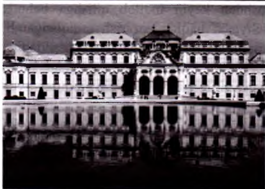
Melk monastiri va Venadagi Belvedere qasri.

xos jihatdir va ular bu uslub bilan har doim g'ururlanadi. Barokko cherkovlari chiroyli tasviriy bezaklarga boydir. Hashamatli eski cherkov yonida muqaddas haykallar o'rnatilgan. Ustun ustida oltin suvi yuritilgan bir qancha farishta haykallari tovlanib turadi. Har xil shakl va rang-barang barokka uslubidagi cherkov protestantlar ustidan bo'lgan g'alabani ifodalashi va katoliklarda ishonch uyg'otishi kerak edi.