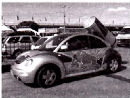
Red Bull – quvvatbaxsh ichimlik.

Ko'p avstriyalik tadbirkorlarning kichik biznesda omadlari chopgan, ammo ularni ko'pchilik tanimaydi. Ba'zan ular urf-odatlariga tashakkur aytadi, xuddi pianino ishlab chiqaruvchi Byozendorfer kabi. «Avval pianinolar, so'ngra Byozendorfer» (mashhur pianino va royal ishlab chiqaruvchi firma), degan edi avstriyalik mashhur jaz musiqachisi Joe Zavinul. Byozendorfer royallari jahonning barcha mashhur konsert zallarida chalingan musiqa asbobi hamda qimmatli ashyo sifatida qaraladi. Ammo, birinchi navbatda, ular Avstriya madaniy merosi sanaladi. Jahonda o'ziga xos mavqega ega yana bir manufaktura Augarten Vena an'anaviy chinni manufakturasidir, uning filiali, hattoki, Yaponiyada ham ochilgan.