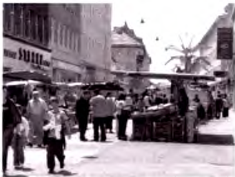
Venaning gavjum joyi – Ottakringdagi Brunnen bozori. Rang-barang, turli madaniyatlarga xos va arzon.

Xuddi birinchi jahon urushidan oldingi Vena kabi, ikkinchi jahon urushidan keyin butun Avstriya sharqiy yevropalik emigrantlar uchun magnitga aylandi. 1945-yildan keyin yuz minglab ish izlaganlar, boshpana qidirganlar, quvgʻin qilinganlar va boshqa emigrantlar toʻl-qini Avstriyaga oqib kela boshladi.