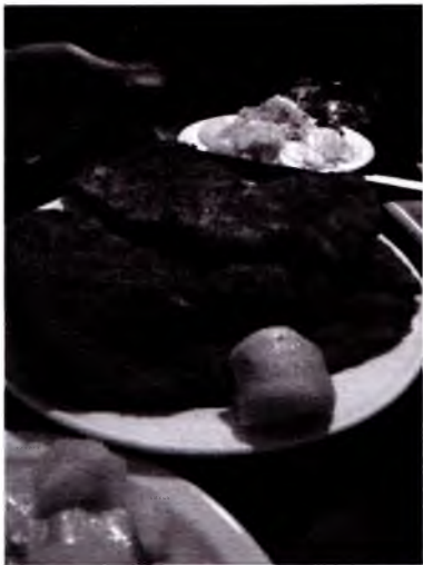
Avstriya shnitsel diyoridir.

ham ishlatiladi. Shnitselga qo‘shimcha sifatida aksariyat odamlar kartoshkali yoki ko‘katli salat, guruch yoki petrushkali kartoshka iste‘mol qiladi.