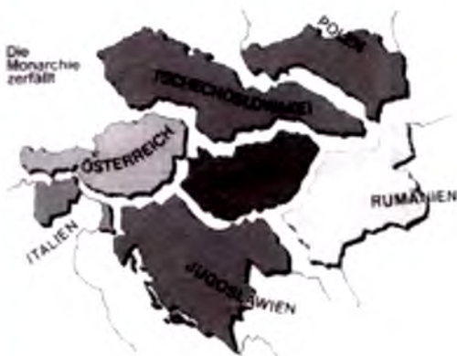
Monarxiya qulash xaritasi.

«Sent Jermen» (1919) shartnomasi muhim joylarning (Janubiy Tirol) qo'ldan ketishiga sabab bo'ldi. Monarxiyaning territoriyasidagi meros davlatlar Avstriyaga dushmanlarcha munosabatda bo'ldi va oziq-ovqat keladigan yo'llarni, ya'ni chegarani yopti. 50 million aholili imperiyaning poytaxti kichkina davlatga katta bo'lib qolgan edi. Oziq-ovqat tanqisligi va ocharchilik hukm surardi. Ko'p odamlar o'z davlatining yashab ketishiga ishonmas edi va