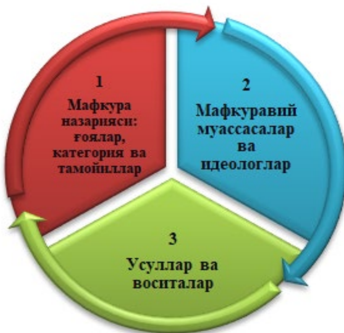
1.1-расм. Мафкуранинг таркибий қисмларининг яхлит кўриниши

Таҳлилларимиз шуни кўрсатдики (ислом ва коммунистик мафкура билан батафсил II бобда ташишиш мумкин), даврийлиги ёки мазмундан қатъий назар, мафкуралар уч таркибий қисмдан ташкил топиши маълум бўлди. Улар: биринчиси, муайян тизимга солинган (илмий, фалсафий, сиёсий, миллий, диний ва бошқа томондан асосланган) ғоялар, категориялар, тамойиллар мажмуи; иккинчиси, мафкурадаги ғоялар, категориялар ва тамойилларни амалиётга татбиқ этувчи субъектив омиллар (мафкуравий муассасалар ва идеологлар); учинчиси, ғоя ва мафкуравий категорияларни амалиётга татбиқ этиш жараёнида қўлланилган йўллар, усуллар ва воситалар (1.1-расм).