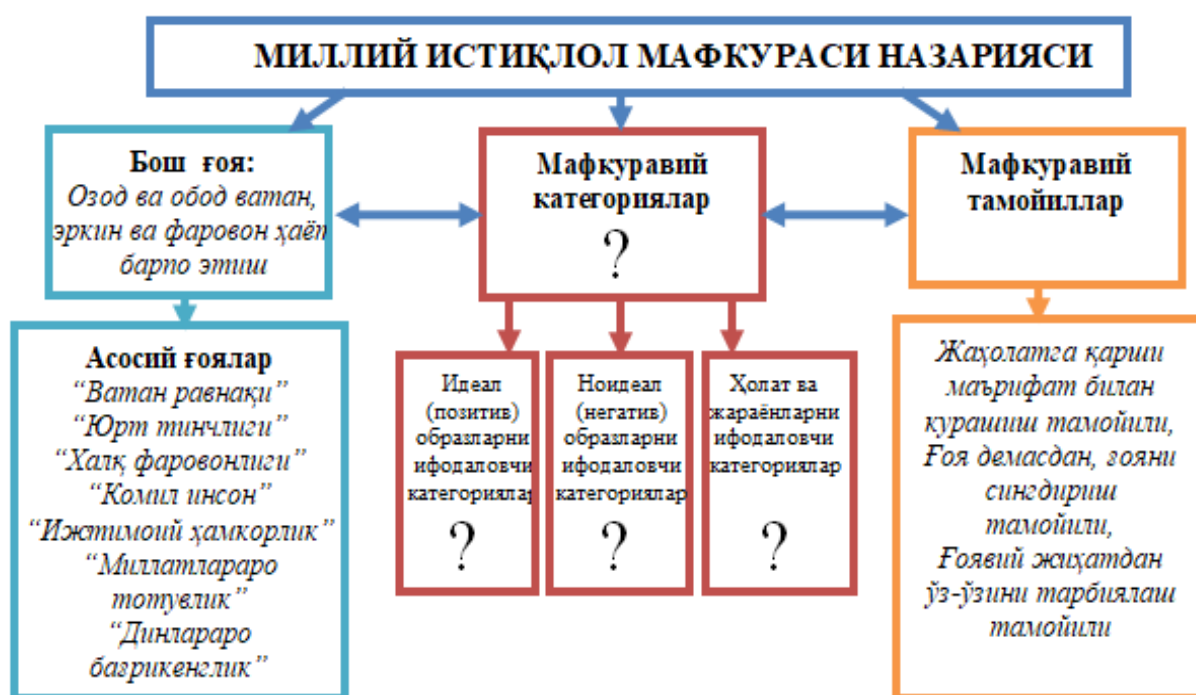
3.1-расм. Миллий истиқлол мафкураси назариясининг умумий кўриниши

функциясига кўра, кенг халқ оммасида образлар, яъни мафкуравий тимсолларни яратади. Дарҳақиқат, тарихан мафкуравий амалиётда муаффақиятга эришган барча турдаги мафкураларда мафкуравий категориялар мавжуд бўлган (1.2 - параграфга қаранг). Мазкур мафкуралар ўз категориялари орқали мафкуравий нуқтаи назардан идеал (позитив) ҳамда мафкуравий мақсадга мос келмайдиган ноидеал (негатив) образларни ва жамиятдаги ҳолат ва жараёнларни аниқ категориялар билан ифодалаб берган. Шунинг учун ҳам улар мафкуравий амалиётда кишиларга эзгулик ва ёвузлик, дўст ва душман образини аниқ кўрсатиб бера олишган.