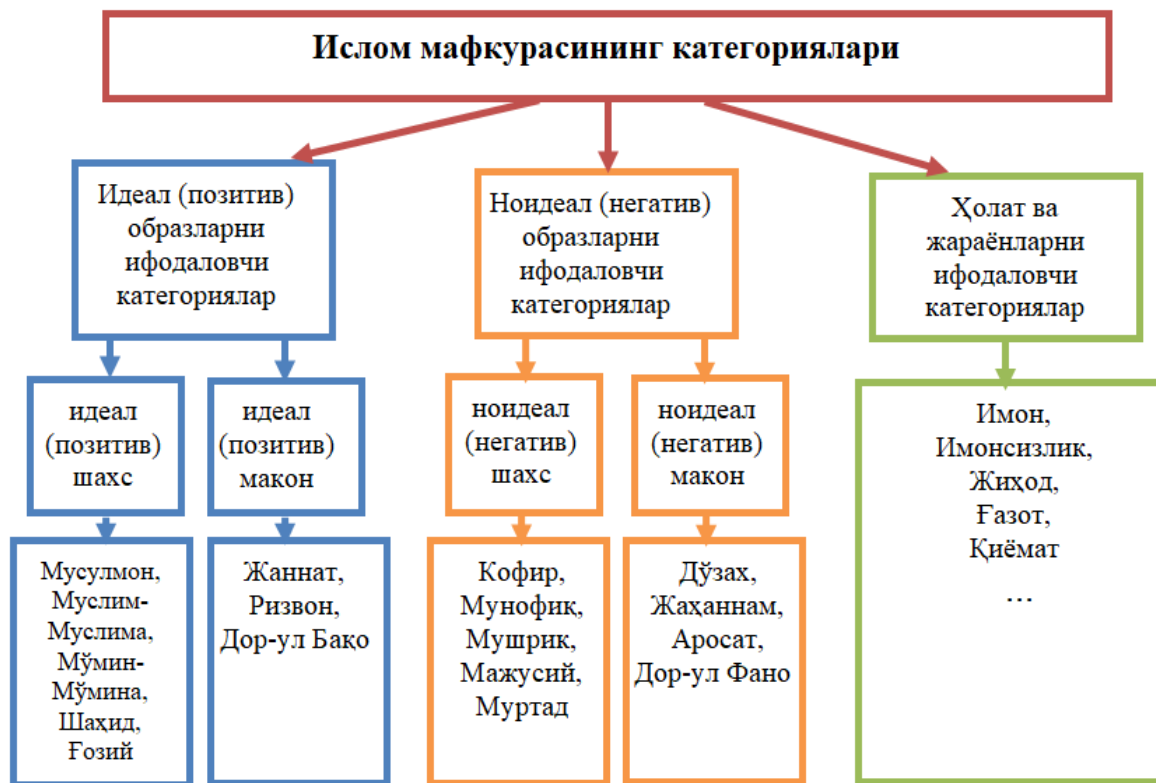
1.3-расм. Ислом мафкурасидаги мафкуравий категориялар

мафкура (1.4-расм)ларда ҳам юқорида таҳлил қилинган мафкуравий категориялар мавжудлигини кўриш мумкин.