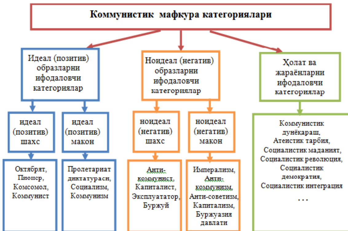
1.4-расм. Коммунистик мафкуранинг мафкуравий категориялари