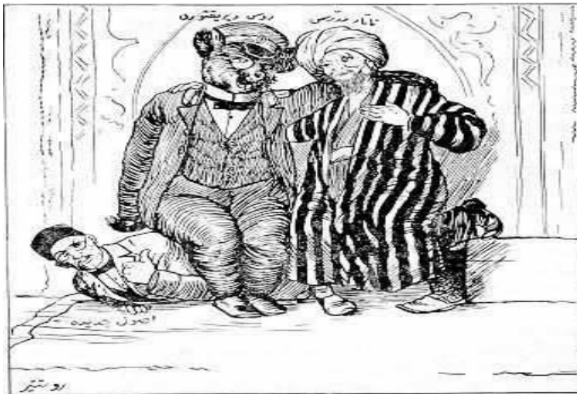
2.1-расм. 1909 йилда Тифлисида нашр қилинган «Мулла Насриддин» журналида чоп этилган «Жадидларнинг маҳаллий дин пешволари ва рус амалдорлари томонидан қаттиқ эзилиши» номли карикатура

христианча рус маданиятини тарғиб этишга асосланган мустамлакачилик ғоялари fronti эди (2.1-расм).