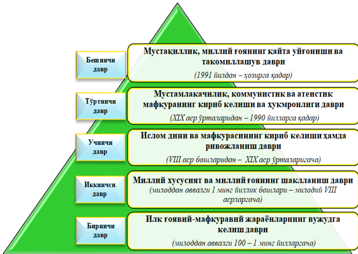
1.5-расм. Ўзбек халқи тараққиётида мафкуравий жараёнлар трансформациялашуви ва уларнинг даврлари

жараёнларни тизимлаштириш имконини берадиган «Ўзбек халқи тараққиётида мафкуравий жараёнлар трансформациялашуви ва уларнинг даврлари»га оид илмий хулоса таклиф этилди (1.5-расм).