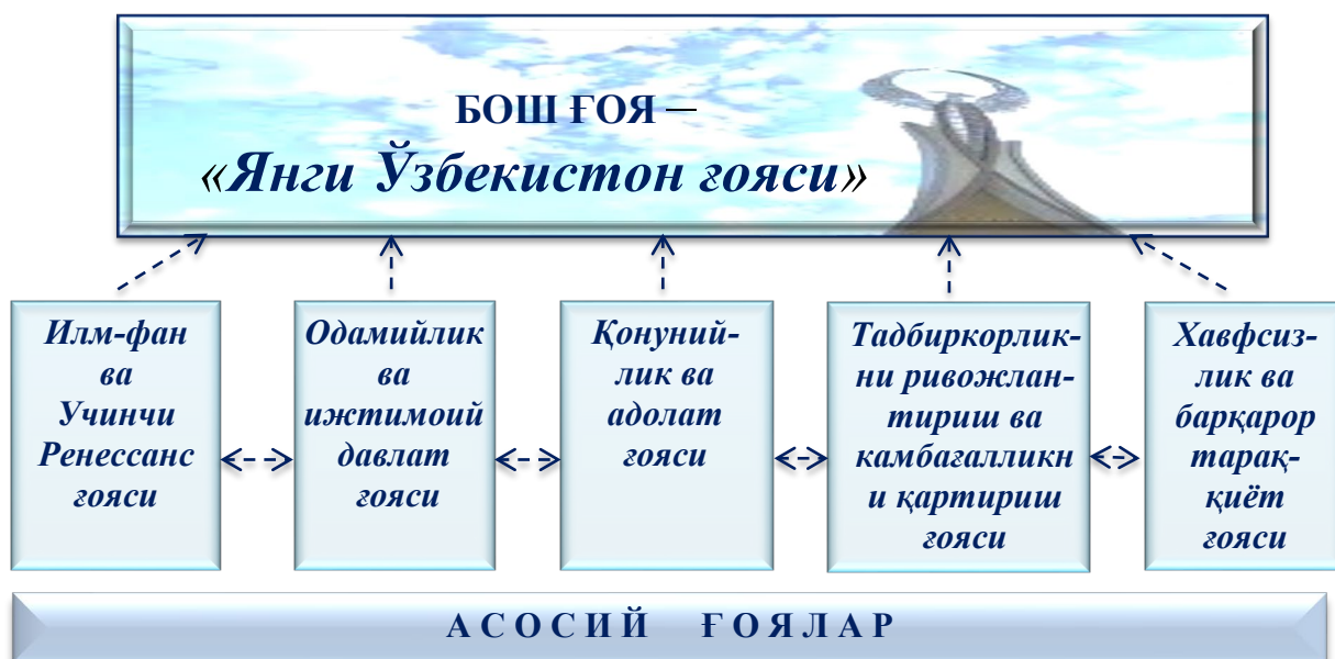
4.1-расм. «Янги Ўзбекистон» мафкурасининг бош ва асосий ғоялари

Янги Ўзбекистон мафкураси учун юқорида таклиф этилган бош ва асосий ғояларини яхлит концепция шаклида ифодаладиган бўлсак, улар қуйидагича намоён бўлади (4.1-расм):