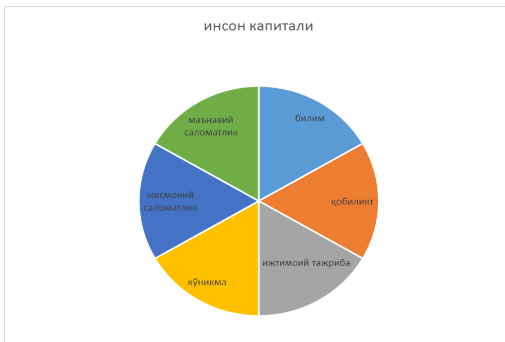
2-rasm. Inson kapitali

Inson resurslari inson salohiyatini tashkil etuvchi tizimning ikkinchi elementi hisoblanadi. Inson resurslarini o‘rganish jarayonida “inson kapitali”, “inson salohiyati”, “hayot sifati” kabi tushunchalarga duch kelamiz. Bu tushunchalar dastlab iqtisodiy fanlarning tushunchasi sifatida ijtimoiy-falsafiy fanlar doirasida tadqiq etiladigan muhim tushunchalariga aylandi.