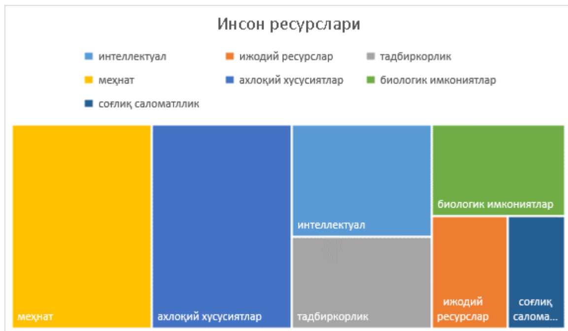
3-rasm. Inson resurslari

Hozirgi kunda ilmiy-falsafiy adabiyotlarda “tabiiy resurslar”, “moddiy resurslar”, “madaniy resurslar”, “turizm resurslari” va h.k. tushunchalar ham keng qoʻllaniladi 1 . Albatta, tabiat yoki er osti resurslari inson faoliyati asosida oʻzlashtirila boshlanganidan keyin inson resurslari sifatida talqin qilinishi mumkin. Ijtimoiy taraqqiyotda inson omilining roli ortib borgani sari inson resurslari ham jamiyat va inson faoliyatiga mos ravishda ortib va ijtimoiylashib boradi.