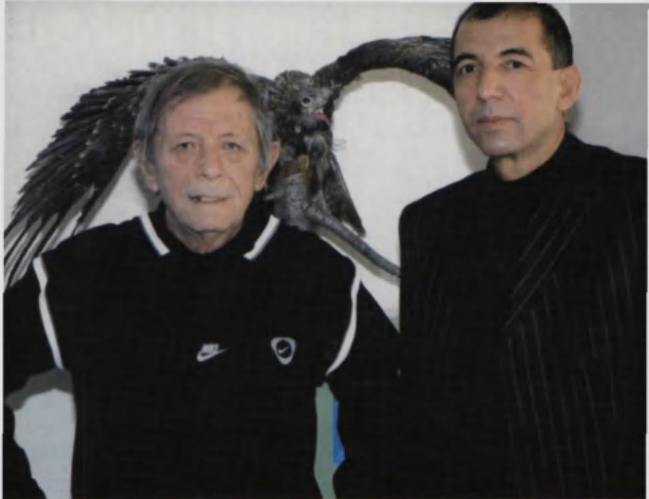
Ўзбекистон халқ шоири Александр Файнберг. 2007 йил.