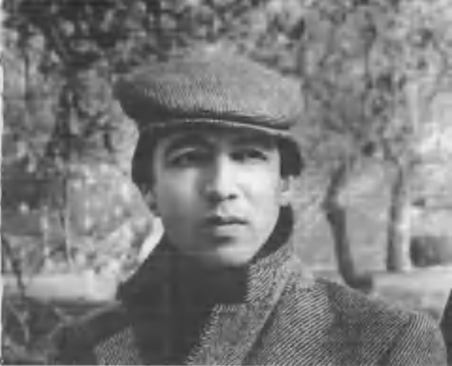
«Энг узоқ сафардир кўнгил сафари» 1985 йил.