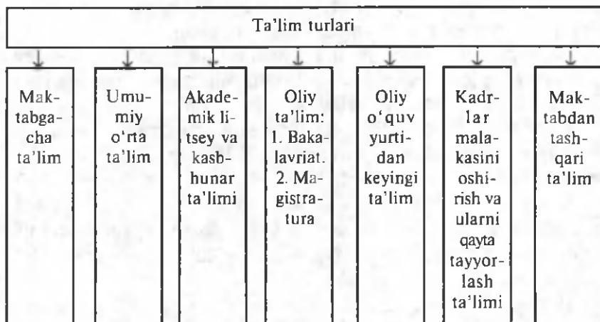
2-chizma. O'zbekiston Xalq ta'limi tizimi.